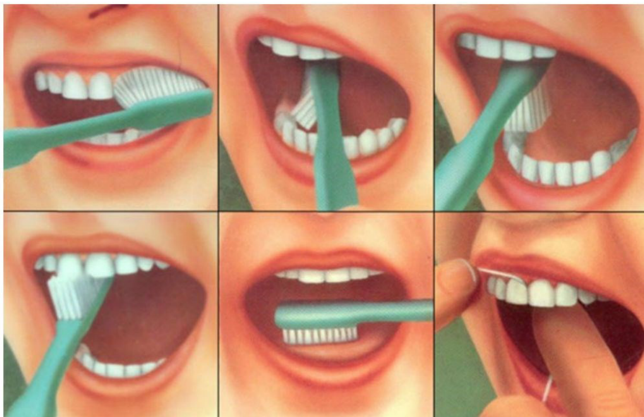
Рис.1 Схема чистки зубов

Детям с ОВЗ этот навык дается гораздо труднее.